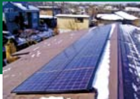
22年12月施工(新屋にて)