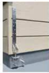
外付けホールダウン金物