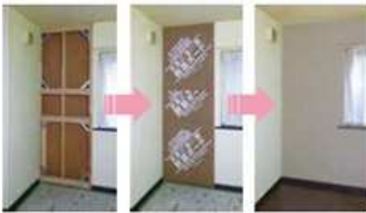
床・天井を残したまま補強する方法

「壁が少ない」、「壁の配置が悪い」住宅の場合は、壁を強くする、あるいは壁を新しく作るなどをして補強します。すでにある壁をはがして、筋かいや構造用合板などで補強し、復旧します。費用を安く抑えるために床や天井を残したまま補強する工法もあります。