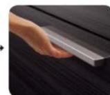
手掛けタイプの取っ手です。