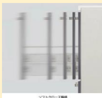
ソフトクローズ機構

ベーシックなお手頃キッチン パナソニックVスタイル ワタケンおすすめパッケージプラン