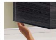
取っ手なし(手掛け仕様)

ベーシックなお手頃キッチン パナソニックVスタイル ワタケンおすすめパッケージプラン