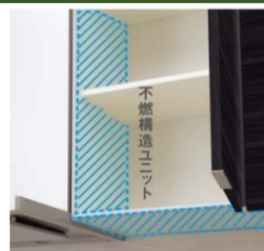
不燃ウォールユニット 標準仕様 ユニット側面と底面は不燃構造です。