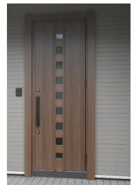
断熱性の高いドアに交換

断熱ならワタケンへお任せください。 費用相場は断熱を行う部位や範囲によって変わってきます。 リフォームするなら断熱も考慮しましょう。 使用頻度の高い空間は特に必要です。 ワタケンなら次世代省エネ基準の秋田の地域にあった材料で 専門家が提案致します。