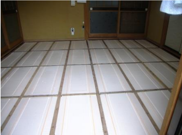
畳を変える時も床断熱を。

床は唯一体が直接触れる部位です。 冬の寒い季節、床が無断熱や断熱不足だと、足元から体が冷えてしまいます。 体感温度が変われば快適度アップ！