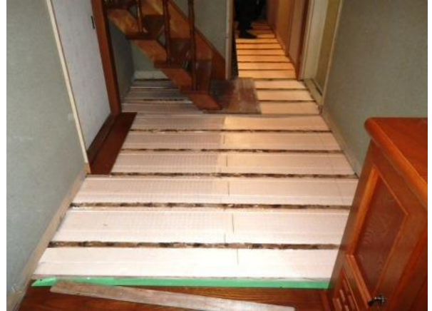
廊下の床を修繕する時にも、しっかりと断熱。