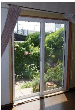
断熱サッシに交換